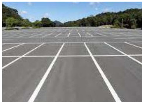
d'octobre à avril, demain